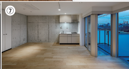
▲①401号室のリビング。窓、テラスが大きく明るい室内②エントランスの館銘板③402号室の防音室の室内④⑤402号室のリビングは41.63㎡のゆとりのある広さ⑥⑦全戸、必ず1面分はコンクリート打ちっ放しの壁を作りスタイリッシュで開放的な表情